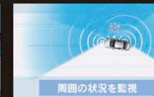
レーンチェンジアシスト [LCA]