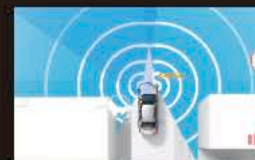
フロントロストラフィックアラート [FCWA]