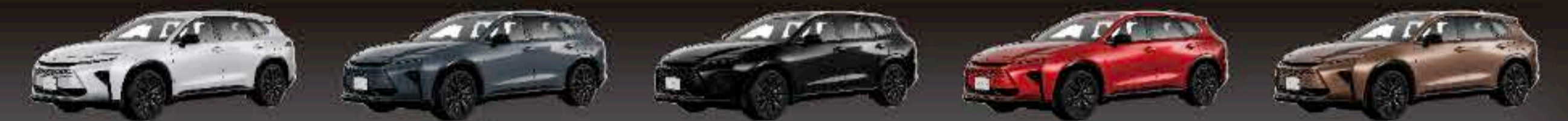
プレシャスホワイトパール(メーカーオプション) マッシュグレー ブラック エモーションナルレッドIII(メーカーオプション) プレシャスブロンズ(メーカーオプション)