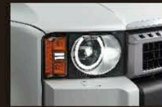
ヘッドランプ(丸目) VX・ZXにメーカーオプション