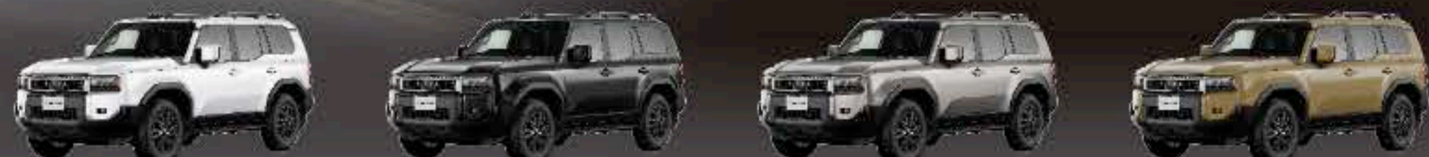
プラチナホワイトパールマイカ(メーカーオプション) ニュートラルブラック アバンギャルドブロンズメタリック サンド