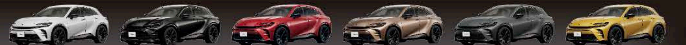
プレシャスホワイトパール(メーカーオプション) ブラック エモーションナルレッドIII(メーカーオプション) プレシャスブロンズ(メーカーオプション) アッシュ マスタード