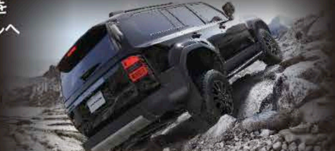
NEWカラー ニュートラルブラック