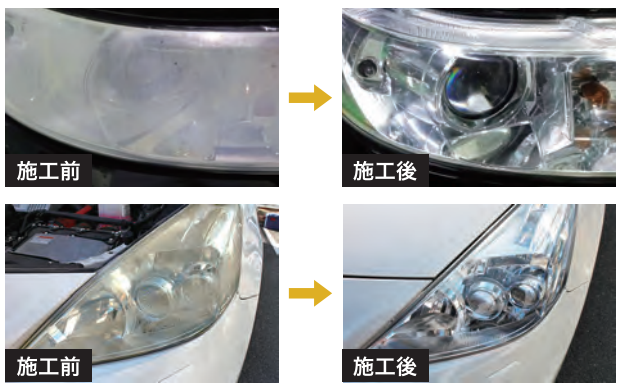
施工前と施工後で、光量にこんなに違いが!

ヘッドライトは夜間に車を走行させる上で安全に直結する重要な部品です。ヘッドライトの光量が足りていないと、視界の広さが変わり、同じ時速でも20m以上も停止距離が延びる場合があります。しっかりと視界を確保することで、安全・快適なドライブを実現!