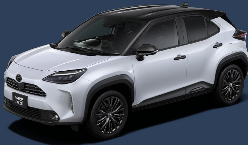
ブラックマイカ(209)×プラチナホワイトパールマイカ(089) [2PU]

軽やかなホワイトと、シックなグレー。ルーフのブラックと融合する、都会的な2色をご用意。