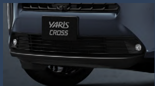
▶LEDフロントフォグランプ