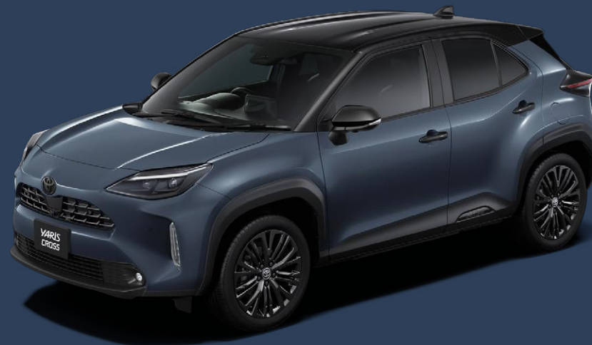
ブラックマイカ(209)×マッシュグレー(1L6) [M23]