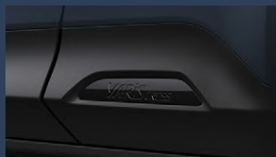
▶サイドオーナメント(ブラック)