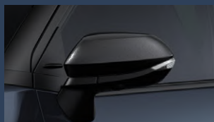
▶LEDサイドターンランプ付オート 電動格納式リモコンドアミラー (ブラック/ヒーター付)