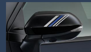
▶ドアミラーステッカー

※ステッカー周辺への高圧洗浄は行わないで ください。ステッカー剥がれの原因となります。