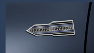
▶フェンダーエンブレム