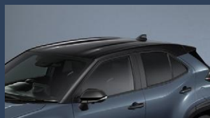
▶ツートーンルーフ(ブラック)