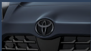
▶トヨタマーク (ブラック/フロント・リヤ)