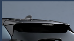
▶リヤルーフスポイラー(ブラック)