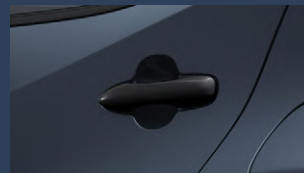
▶アウトサイドドアハンドル (ブラック)