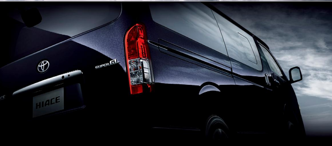
Photo:特別仕様車スーパーGL“DARK PRIME II”(2WD・2800ディーゼル・標準ボディ)[ベース車両はスーパーGL(2WD・2800ディーゼル・標準ボディ)]. ボディカラーの特別設定色スパークリングブラックパールクリスタルシャイン<220>はメーカーオプション。