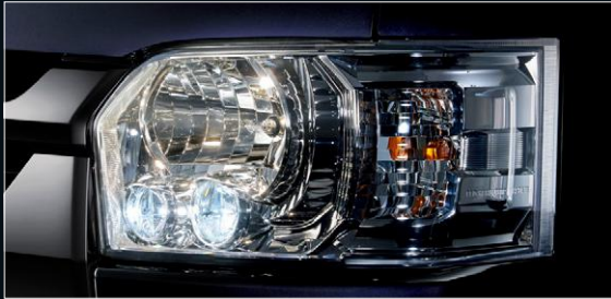
■ LEDヘッドランプ(クリアスモーク加飾)