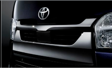
■ メッキフロントグリル(ダークメッキ)