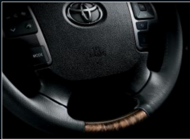
■ 4本スポークステアリングホイール (本革巻き+黒木目マホガニー調加飾)