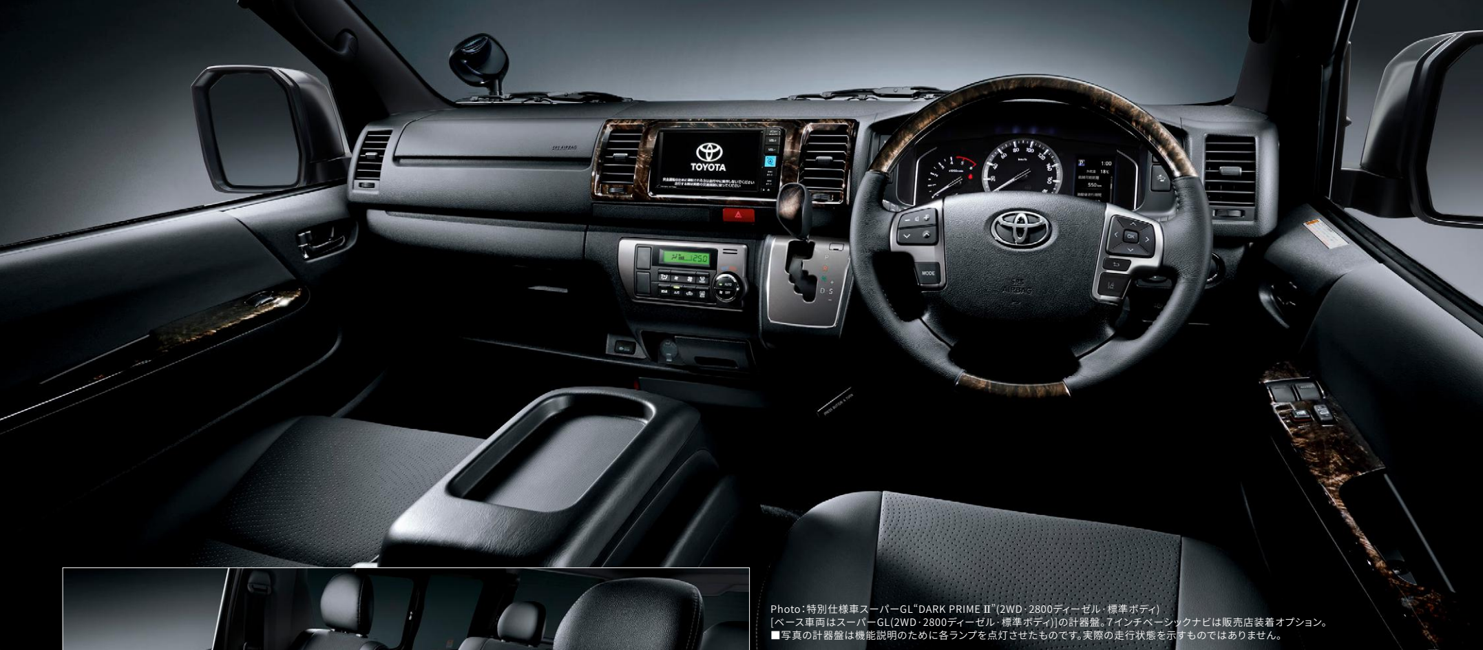
Photo:特別仕様車スーパーGL“DARK PRIME II”(2WD・2800ディーゼル・標準ボディ) [ベース車両はスーパーGL(2WD・2800ディーゼル・標準ボディ)]の計器盤。7インチベータシクナビは販売店装着オプション。 ■写真の計器盤は機能説明のために各ランプを点灯させたものです。実際の走行状態を示すものではありません。