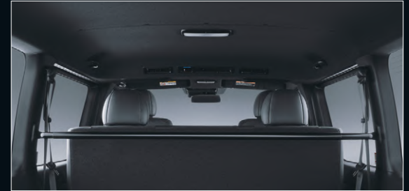
■ ルーフ&ピラー(ブラック)