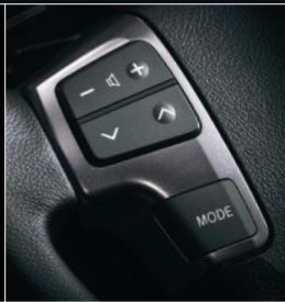
■ ステアリングスイッチベゼル (ダークシルバークラッシュ)