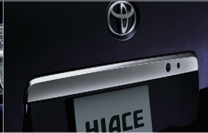
■ メッキバックドアガーニッシュ(ダークメッキ)