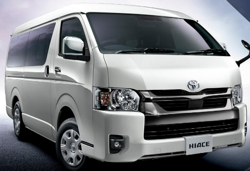
Photo:特別仕様車スーパーGL“DARK PRIME II”(2WD・2800ディーゼル・標準ボディ) [ベース車両はスーパーGL(2WD・2800ディーゼル・標準ボディ)]。 ボディカラーの特別設定色スパークリングブラックパールクリスタルシャイン<220>はメーカーオプション。