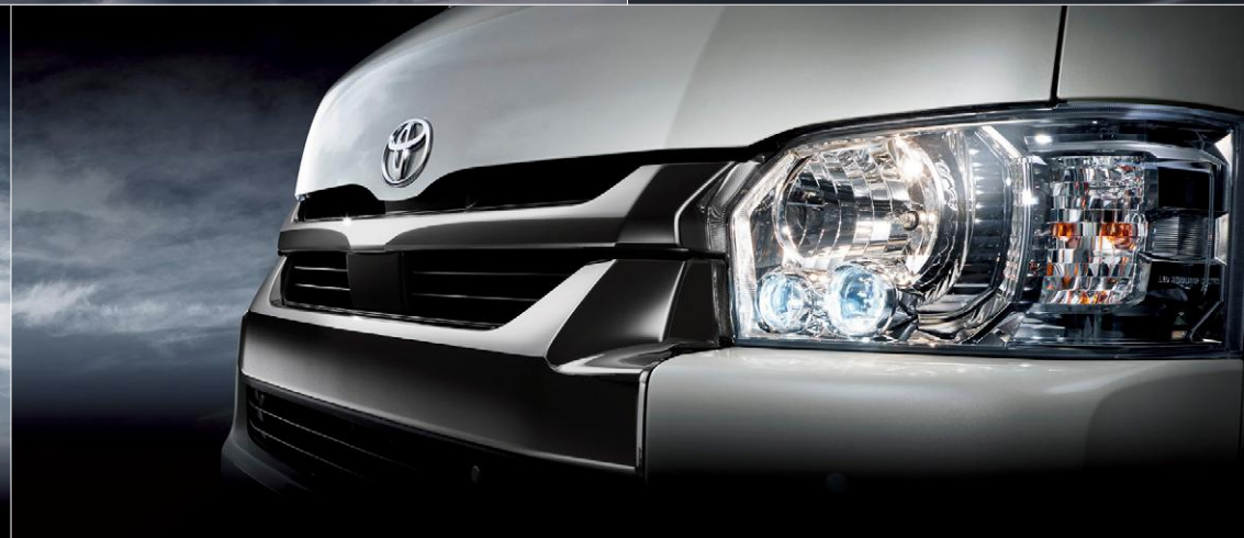
Photo:特別仕様車スーパーGL“DARK PRIME II”(4WD・2700ガソリン・ワイドボディ)[ベース車両はスーパーGL(4WD・2700ガソリン・ワイドボディ)]. ボディカラーのホワイトパールクリスタルシャイン<070>はメーカーオプション。