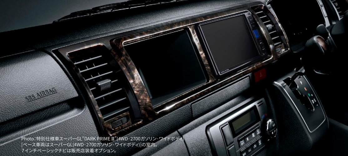
Photo:特別仕様車スーパーGL“DARK PRIME II”(4WD・2700ガソリン・ワイドボディ) [ベース車両はスーパーGL(4WD・2700ガソリン・ワイドボディ)]の室内。 7インチタッチナビは販売店装着オプション。