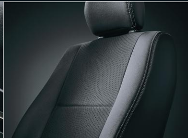
■ シート表皮:トリコット+合成皮革& ダブルステッチ(ダークグレー)