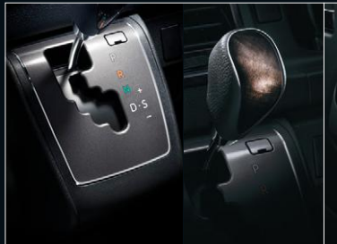
■ シフトベゼル(ダークシルバークラッシュ) ■ シフトノブ(本革+黒木目マホガニー調加飾)