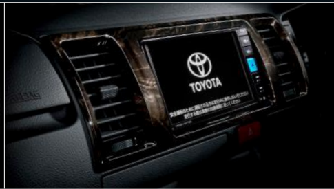
■ インstrumentパネルアッパー部(黒木目マホガニー調加飾) ※写真の7インチベシクナビは販売店装着オプション。