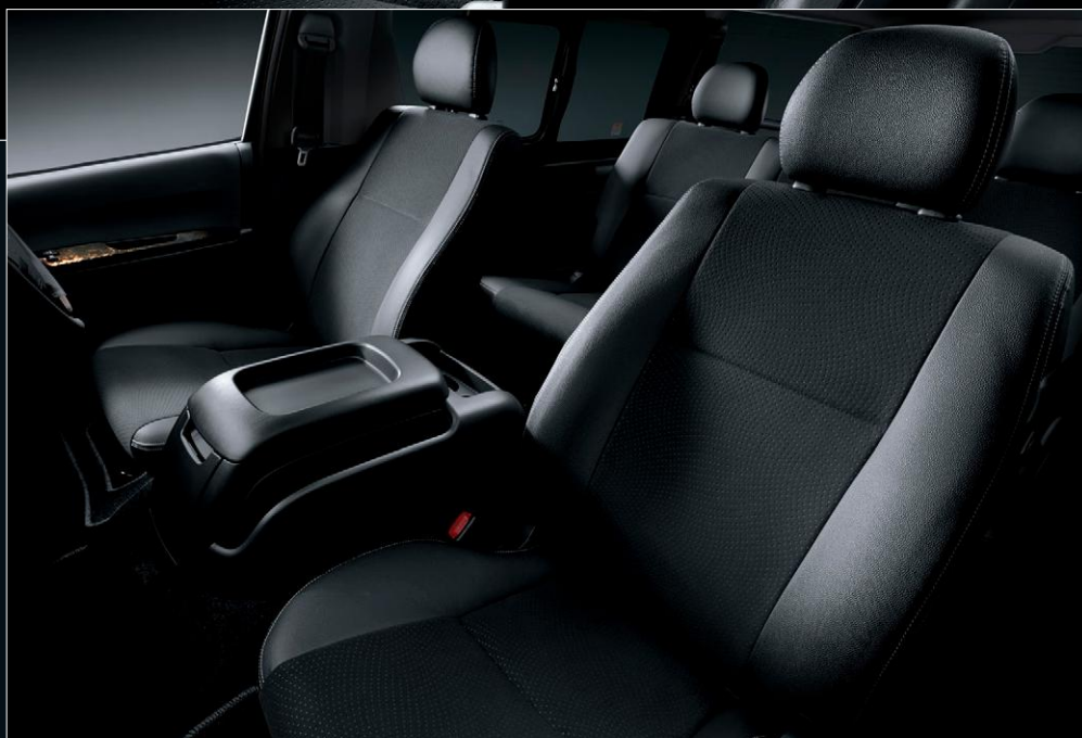
Photo:特別仕様車スーパーGL“DARK PRIME II”(2WD・2800ディーゼル・標準ボディ)[ベース車両はスーパーGL(2WD・2800ディーゼル・標準ボディ)]の室内。