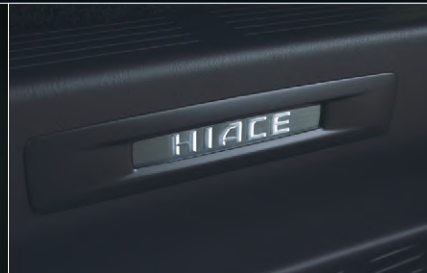
■ スライドドアスカッフプレート (車名ロゴ&イルミネーション付)