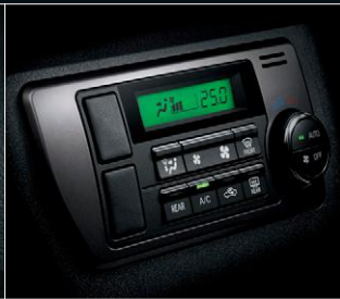
■ フロントエアコンプッシュ式コントロールパネル (ダークシルバークラッシュ)