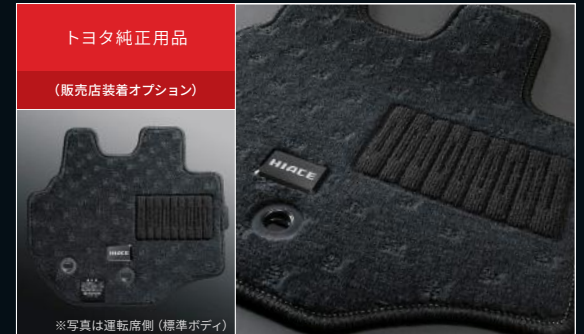
■ フロアマット(特別仕様車専用) 材質: ポリプロピレン 色: ダークグレー 1台分 28,600円 (消費税抜き 26,000円) (AOGD)