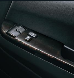
■ フロントドアトリム(合成皮革) ■ パワーウィンドウスイッチベース (黒木目マホガニー調加飾)