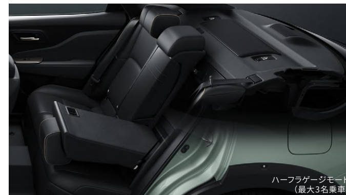
ハーフラゲージモード (最大3名乗車)