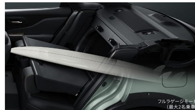
フルラゲージモード (最大2名乗車)