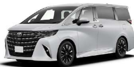
プラチナホワイトパールマイカ(089)*1