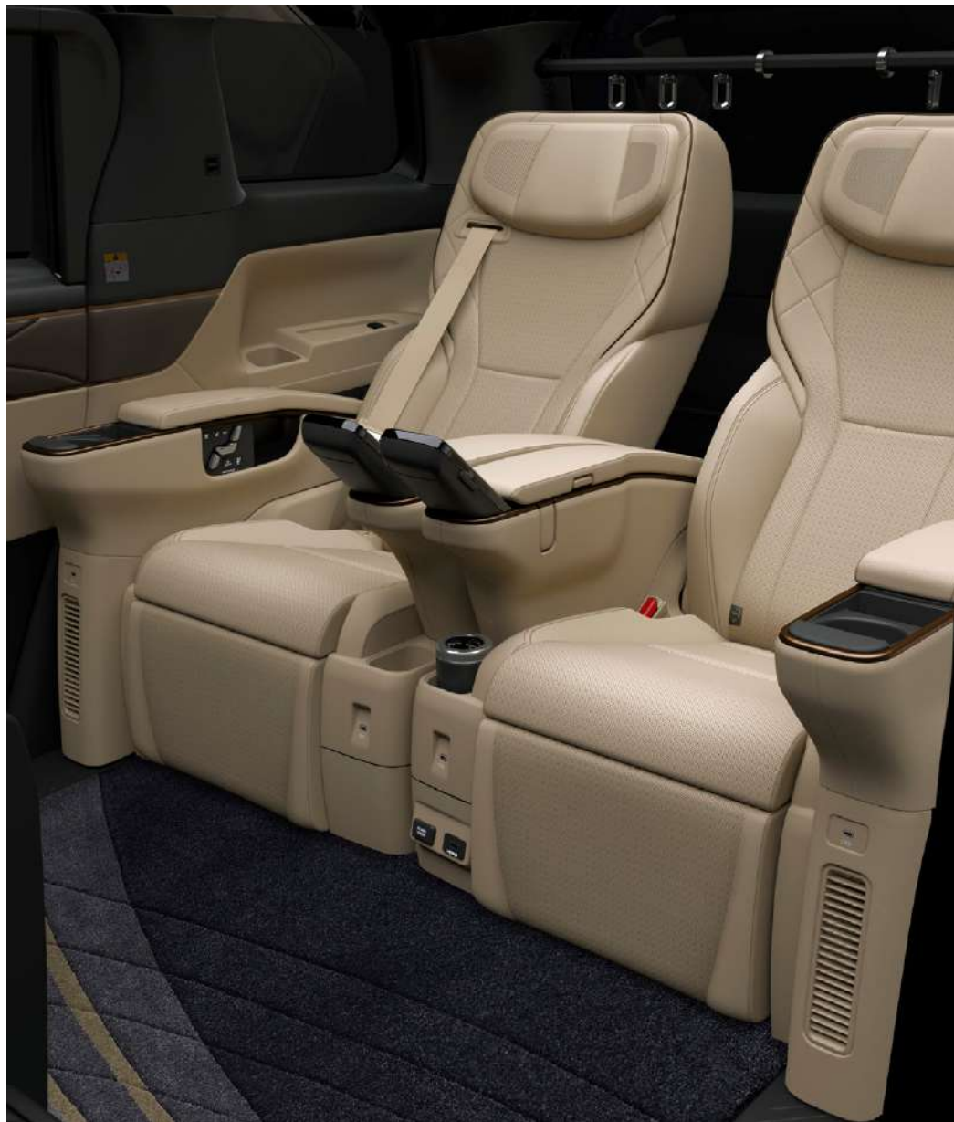
Photo: Spacious Lounge (ハイブリッド・E-Four) の室内。内装色のニュートラルベージュは設定色 (ご注文時に指定が必要です。指定がない場合はブラックになります)。