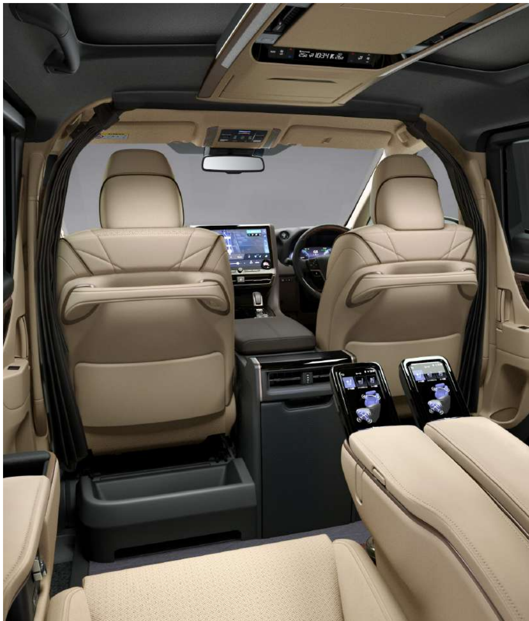
Photo: Spacious Lounge (ハイブリッド・E-Four) の室内。内装色のニュートラルベージュは設定色(ご注文時に指定が必要です。指定がない場合はブラックになります)。

手荷物などを置けるトレイ。縦長の鞆などを置いても倒れにくい、大型の収納スペースになっています。