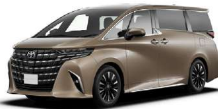
プレシャスレオプロンド(4Y7)*2