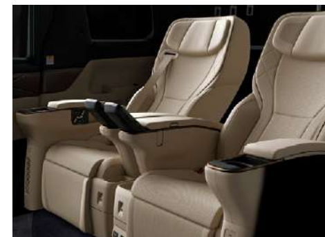
ニュートラルベージュ