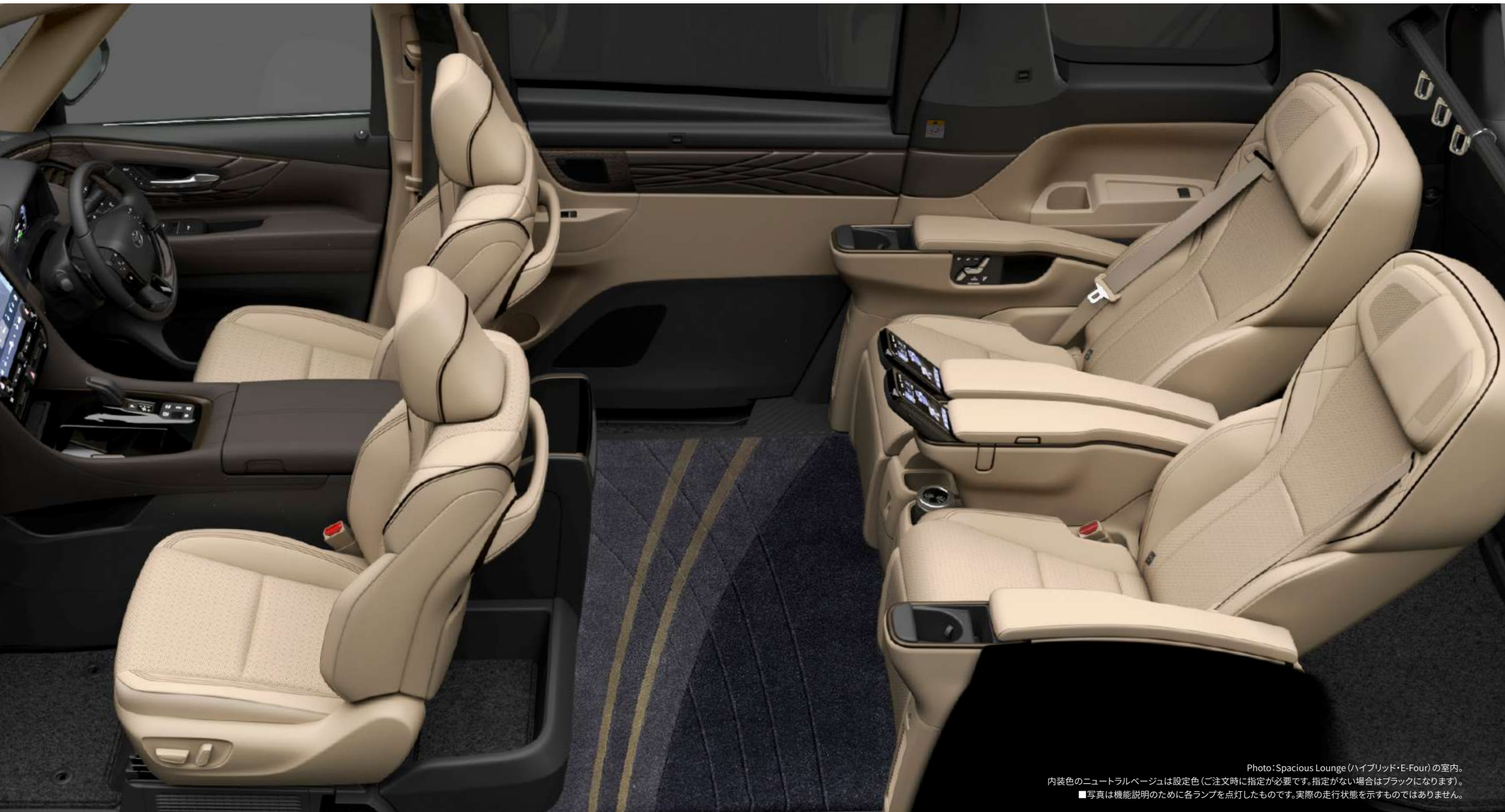
Photo: Spacious Lounge (ハイブリッド・E-Four) の室内。 内装色のニュートラルベージュは設定色 (ご注文時に指定が必要です。指定がない場合はブラックになります)。 ■写真は機能説明のために各ランプを点灯したものです。実際の走行状態を示すものではありません。

包まれる。癒される。満たされる。 ここにアルファード史上、最上クラスのラグジュアリー。