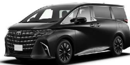
ニュートラルブラック(229)