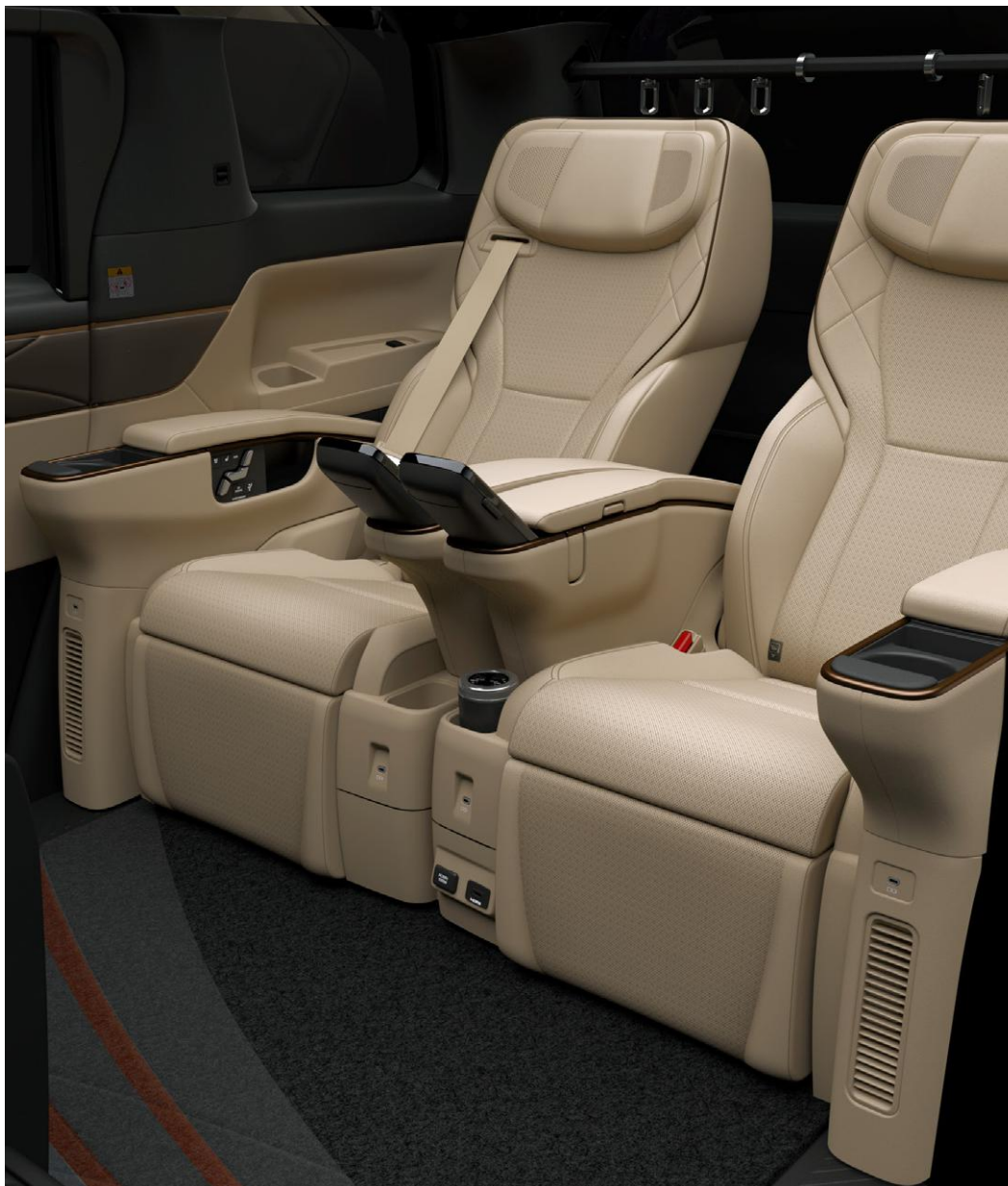
Photo: Spacious Lounge (ハイブリッド・E-Four) の室内。内装色のニュートラルベージュは設定色(ご注文時に指定が必要です。指定がない場合はブラックになります)。