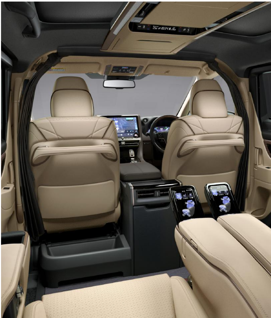
Photo: Spacious Lounge (ハイブリッド・E-Four) の室内。内装色のニュートラルベージュは設定色 (ご注文時に指定が必要です。指定がない場合はブラックになります)。

▲注意: 挿込み型心臓ペースメーカー等の医療用電気機器を装着されている方は、おくだけ充電のご使用にあたっては医師とよくご相談ください。充電動作が医療用電気機器に影響を与えるおそれがあります。