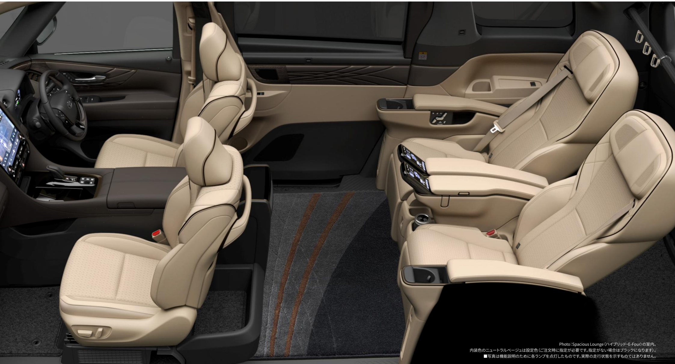
Photo: Spacious Lounge (ハイブリッド・E-Four)の室内。 内装色のニュートラルベージュは設定色(ご注文時に指定が必要です。指定がない場合はブラックになります)。 ■写真は機能説明のために各ランプを点灯したものです。実際の走行状態を示すものではありません。

包まれる。癒される。満たされる。 ここにアルファード史上、最上クラスのラグジュアリー。