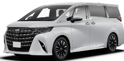
プラチナホワイトパールマイカ(089)*1