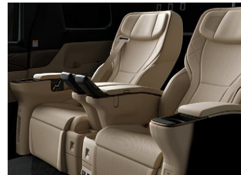
ニュートラルベージュ