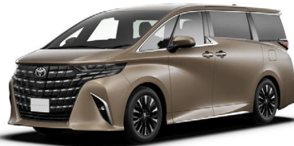
プレシャスレオプラント(4Y7)*2