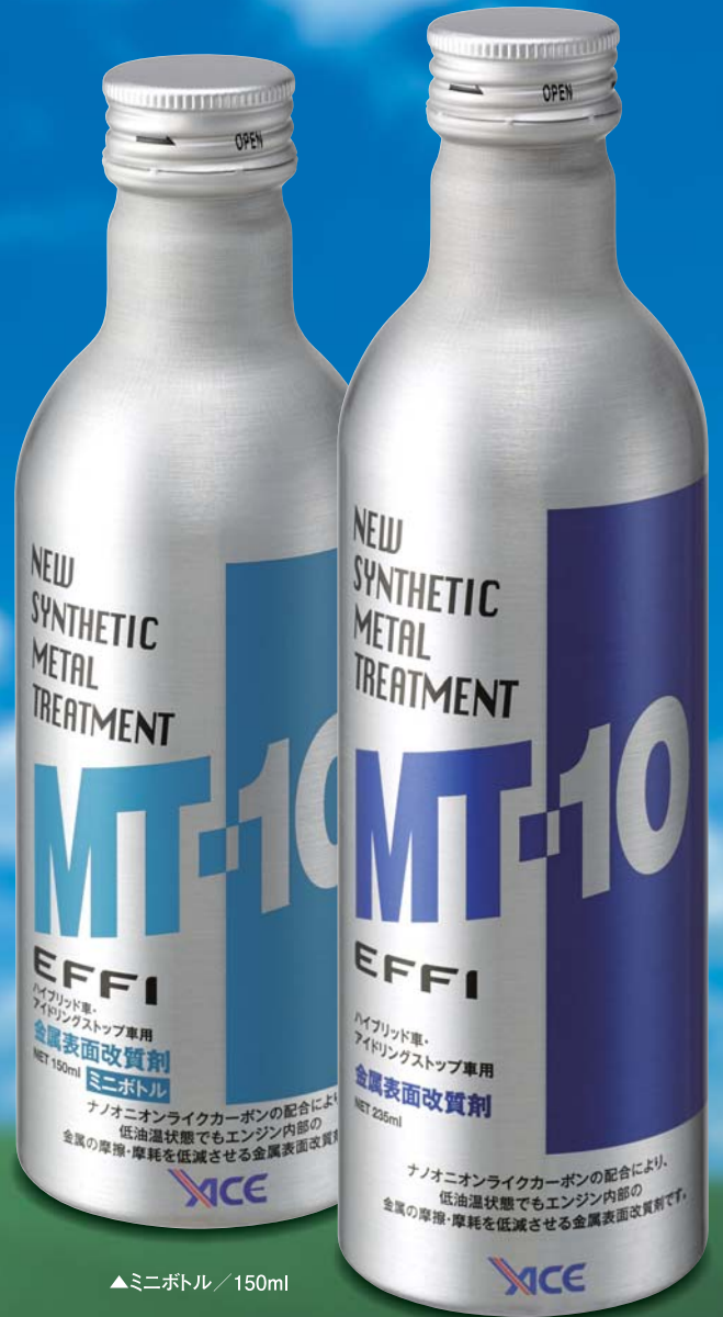
▲ミニボトル / 150ml