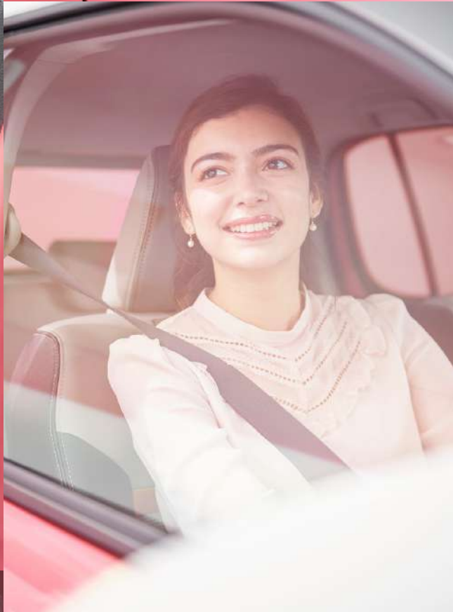
SPECIAL EQUIPMENT | 合成皮革+ファブリックシート表皮

お気に入りの空間で、 笑ったり、驚いたり、キュンとしたり。 前へ、遠くへ、走るほど、きっと心も動くはず。 かわいいは、毎日のエンジンです。