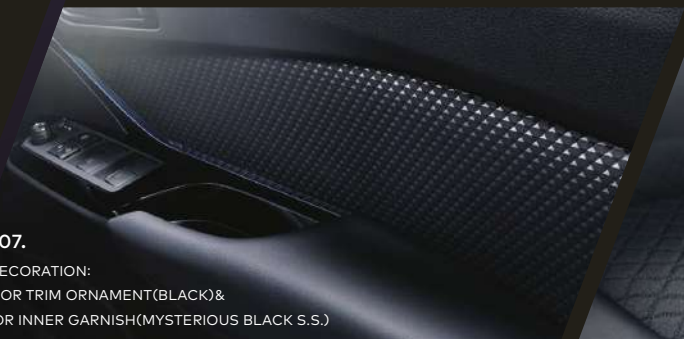
07. DECORATION: DOOR TRIM ORNAMENT(BLACK)& DOOR INNER GARNISH(MYSTERIOUS BLACK S.S.)