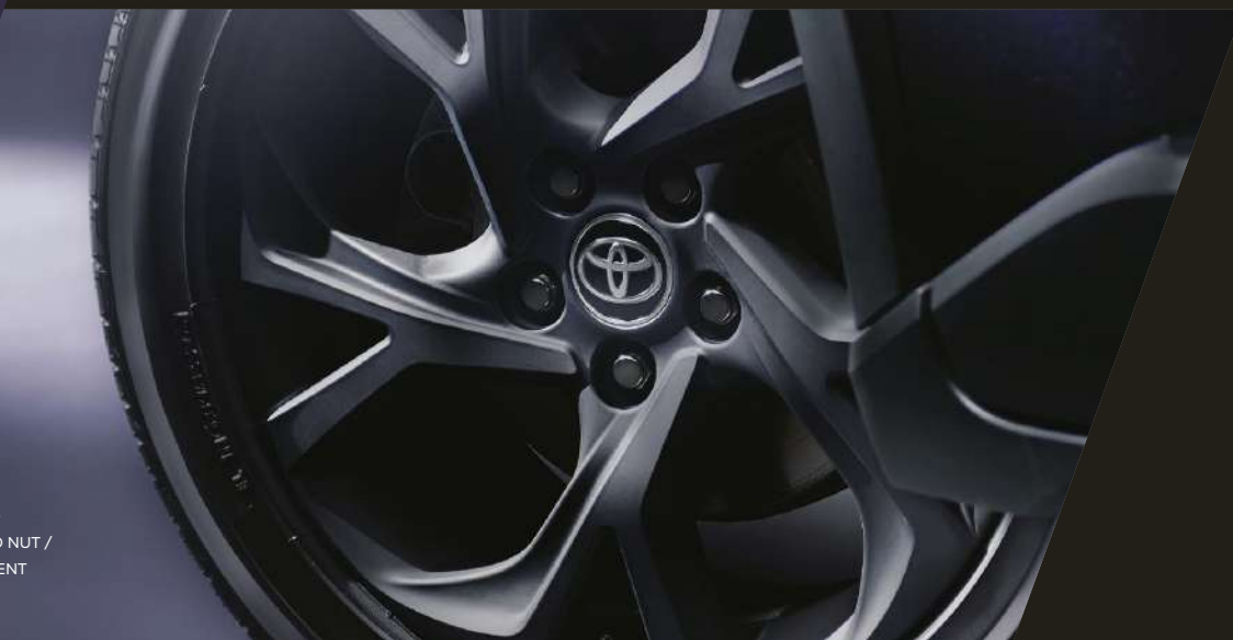
Photo:特別仕様車G-T “Mode-Nero Safety Plus II” (2WD) [ベース車両はG-T(2WD)]。ボディカラーの特別設定色スパークリ ングブラックパールクリスタルシャイン(220)はメーカーオプション。 ■写真は合成です。*“Mode-Nero”の“Nero”は、イタリア語で 「黒色」を意味する言葉です。

WHEEL: MAT BLACK PAINT + DARK SMOKE PLATED NUT / WITH CENTER ORNAMENT