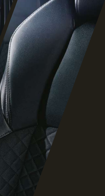
06. SEAT:HIGH-GRADE FABRIC (BLACK) + LEATHER (BLACK) & EXCLUSIVE STITCHING (BLACK)