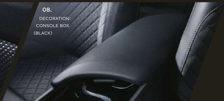
08. DECORATION: CONSOLE BOX (BLACK)